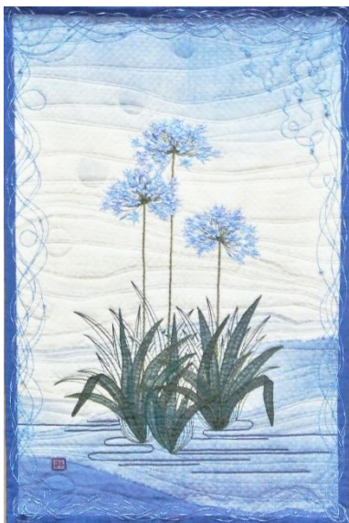
第41回新洋画会展(2019) 優秀賞 アガパンサス 155×105 cm

いつも自分を好きでいたいと思うのです。済んでしまった過去を引きずらない。まだ来てもない未 来を心配しない。今この時を悔いなく生きたいと思う。これからもどうぞよろしくお願ひいたします。