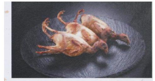
三河山吹うずら (みかわやまぶきうずら)