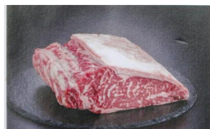
豊橋牛 (とよはしうし)