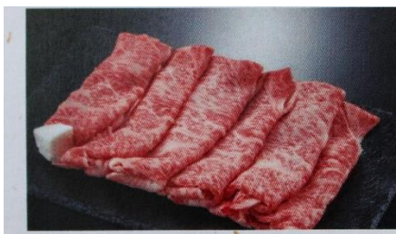
源氏和牛 (げんじわぎゅう)