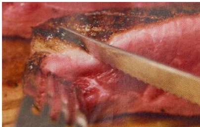
あいち鴨(あいちがも)

店頭では、こだわりの厳選肉「源氏和牛」、「段戸山高原牛」、「豊橋牛」、「三河山吹うずら」、「三州豚」、「猪」や「鹿」など、80年以上の長い年月をかけて築き上げられた生産者や加工者との信頼関係があるからこそ得られる屈強な協力体制もあり、豊富なオリジナル商品も順調に売上也伸びています。 当店の精肉を紹介します。