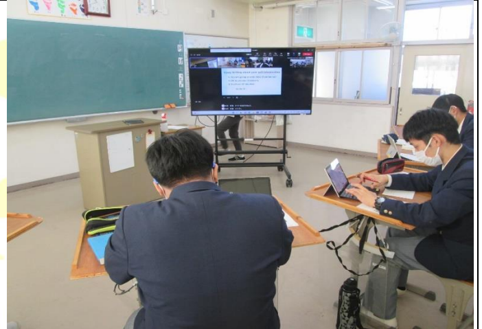
▲豊橋聾学校の生徒の皆さん