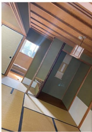
↑作法室から見える景色