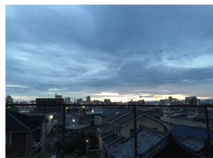
↑武道場の後ろから見える景色