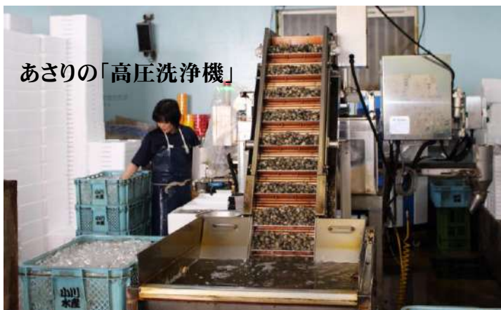
あさりの「高圧洗浄機」

しかしながら現状に満足する事なくさらに満足度の高い商品をお届けできるよう邁進してまいります。