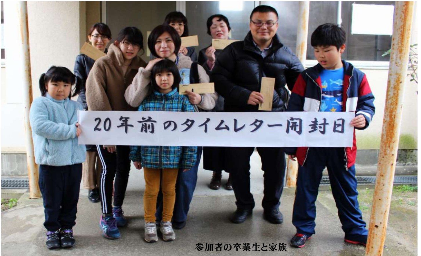
参加者の卒業生と家族

しかし、当時の保護者と卒業生連名の連絡のハガキを送付したが、5通が届かず戻って来たことは長い 年月の変化を感じています。開封日が悪天候で雨に見舞われたのが残念であった。