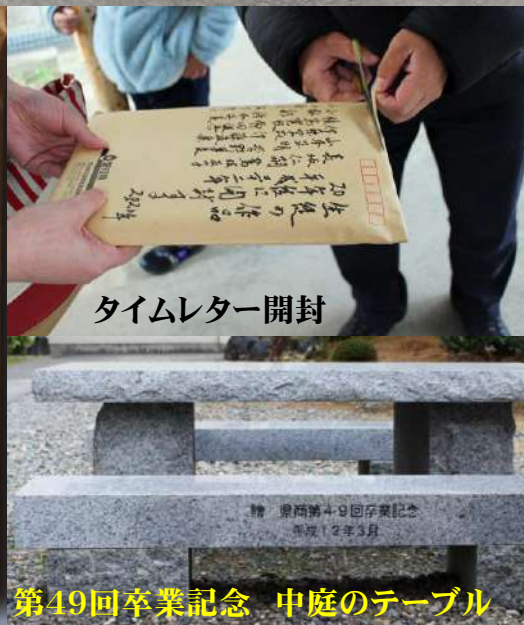
タイムレター開封