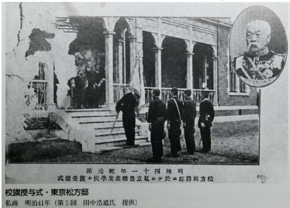
前元紀年一十四治明 式領受旗×校學業商橋豊立私ルケ於ニ邸爵候方松