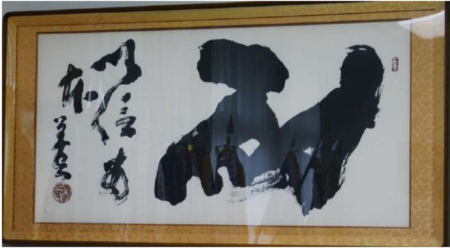
「耐」以信為本 創立 75 周年・寄贈 昭和 56 年(1981 年)