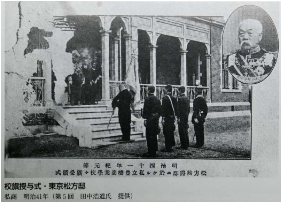
前元紀年一十四治明 式領受旗×校學業商橋豊立私ルケ於ニ邸爵候方松