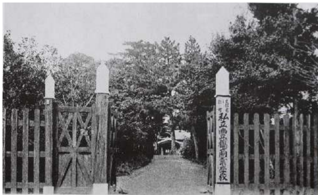
明治 39 年4月、竣工した校舎(現豊橋瓦町)

商業学校設立の経緯は、明治 34 年1月の商議所(当時は商工会議所という名称ではなかった)の会議録によれば、遠藤は同年二月、十一月、36 年十二月にも、この議案を提出するも採択されず、また自分の属する実業談話会を通じて郡、豊橋町(町長大口喜六)に度々請願するも採択の機に至らなかったで遂に私費を以って建設する事に意を決し、明治 39 年四月渥美郡豊岡町(現瓦町)不動院東に私立豊橋商業学校を建設した。(豊商の群像 I より抜粋)