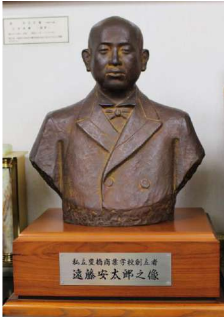
遠藤家より寄贈(平成9年2月28日)