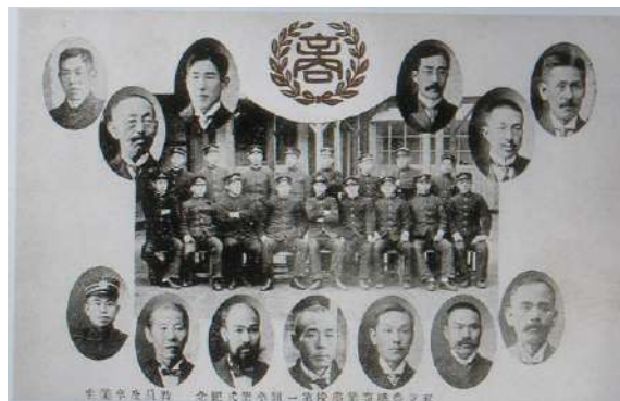
私立商業学校 第一回卒業式 記念、教員、 及び卒業生