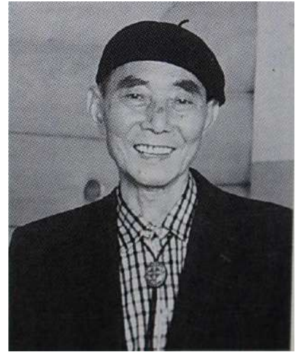
「耐」以信為本 創立 75 周年・寄贈 昭和 56 年(1981 年)